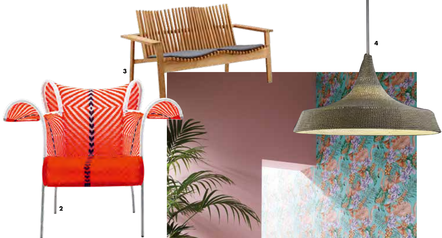
1. Tigmi 户外双人椅 (价洽店内 Dedon) 2. 户外编织椅 (价洽店内 Morosa) 3. Amaze 户外双人椅 (价洽店内 Cane-line) 4. Vex 编织吊灯 (约 5400 元 Naomi Paul) 5. Copa Set 编织椅 (价洽店内 Made.com) 6. 撞色竹纸篓 (199 元 Zara Home) 7. 动物靠包套 (159 元 Zara Home)