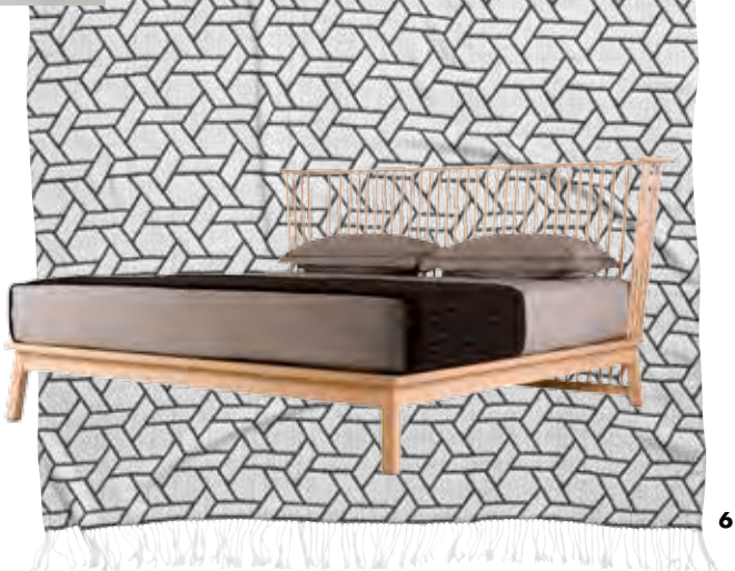
1. Dancer 木架床 (价洽店内 Plinio il Giovane) 2. Spring 床 (约 2000 元 Made.com) 3. Union 床 (价洽店内 De La Espada) 4. De Beauvoir 屏风 (约 20000 元 House of Hackney) 5. 毛毯 (299 元 H&M Home) 6. Companions 木架床 (价洽店内 De La Espada)