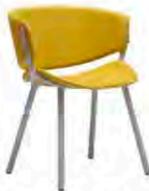
Chaise "Phoenix". Offect (2016)