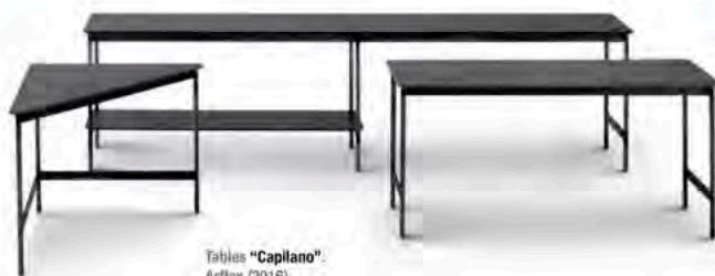
Tables "Caplano". Artflex (2016)