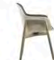
Fauteuil "Stella". De La Espada (2016)