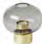
Luminaire "Uki". Mjolk (2016)